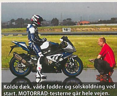
Kolde dæk, våde fødder og solskoldning ved start. MOTORRAD-testerne går hele vejen.