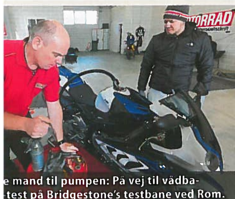
En mand til pumpen: På vej til vådbæretest på Bridgestone's testbane ved Rom.

Facit Multicomound kan være med til at skille fårene fra bukkene i dette afsnit, men er ikke altid lig med succes. Eksempelvis Michelin: Power 3's 2-komponentblanding overbeviser også i holdbarhed, da der efter 4000 km stadig er mere end rigeligt mønster på dækkene. Bridgestone S20 Evo stiller op med hele tre forskellige hårdheder i gummiblandingen – men taber tydeligvis i direkte sammenligning.