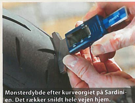
Mønsterdybde efter kurveorgiet på Sardinien. Det rækker snildt hele vejen hjem.