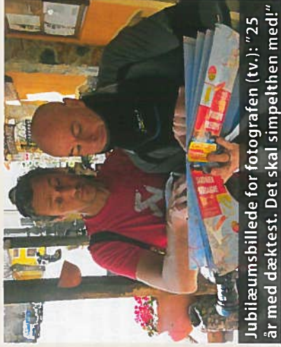
Jubilæumsbillede for fotografen (tv.): "25 år med dæktest. Det skal simpelthen med!"