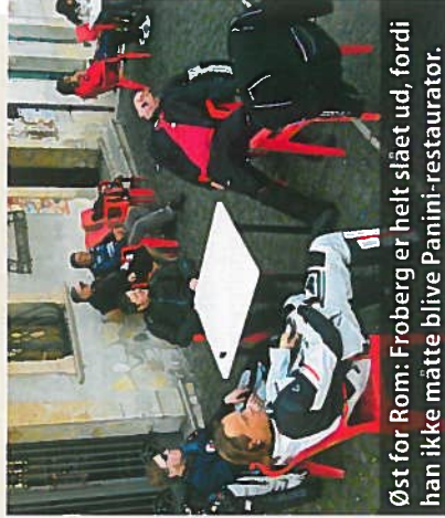
Øst for Rom: Froberg er helt slæet ud, fordi han ikke måtte blive Panini-restaurator.